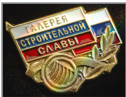
Нагрудный знак «Галерея строительный славы»

Список лауреатов «Галереи строительной славы» печатается в официальном ежегодном каталоге «Российский Строительный Олимп», в федеральных и региональных СМИ – официальных партнерах программы.