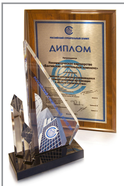
НП «Балтийский строительный комплекс» – лауреат премии «Российский Строительный Олимп»