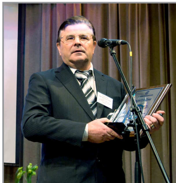
НП «Саморегулируемая организация Союз строительных компаний Урала и Сибири» – лауреат премии «Российский Строительный Олимп»

НП «Сахалинское саморегулируемое объединение строителей» (г. Южно-Сахалинск) – в номинации «Ведущая региональная саморегулируемая организация в области строительства»;