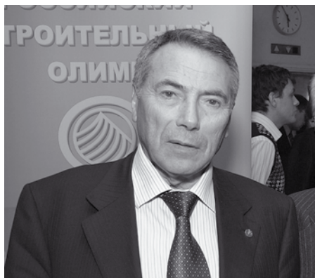
Е.В. Басин, Президент Национального объединения строителей